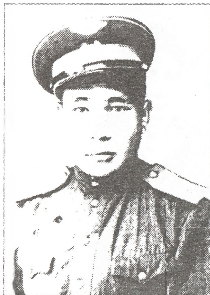
Армияға сулууспалы сылдын (1948 с.)