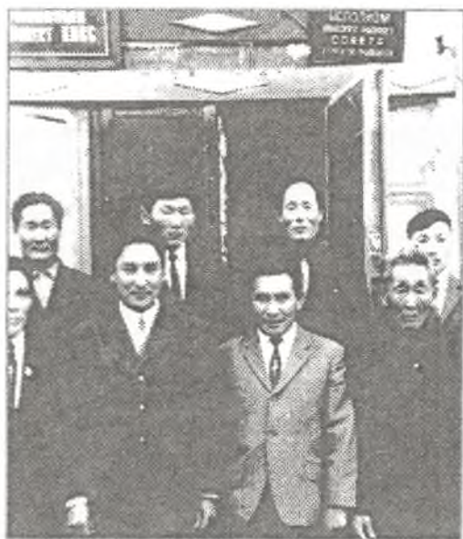
Оройуон булчуттарын слета. (1971 с.)